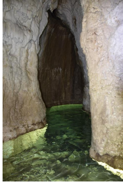
Sergio Mauro ha portato in digitale vecchie foto o dia analogiche: ottimo lavoro tecnico, ottime foto.