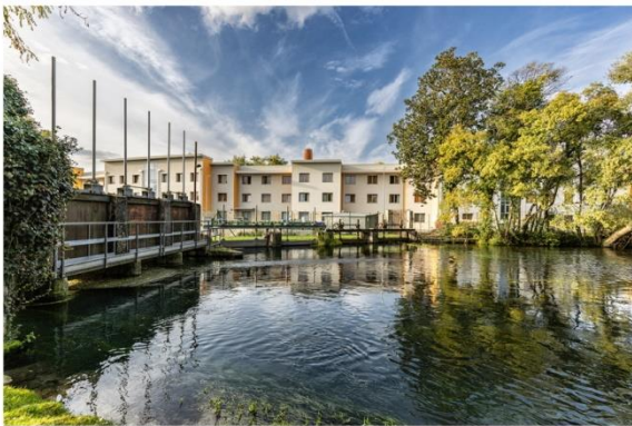
Chiusa canale Amman