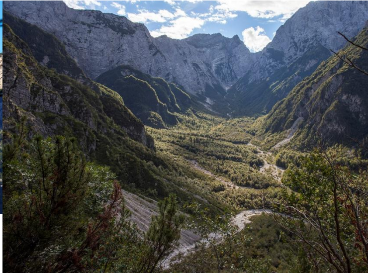
L'aquila del Frascola e la Val Chialedina.